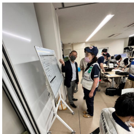
記録内容を確認している様子