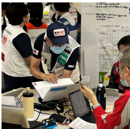
本部での情報収集活動の様子