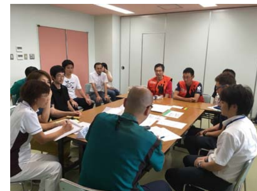
訓練終了後の振り返り会