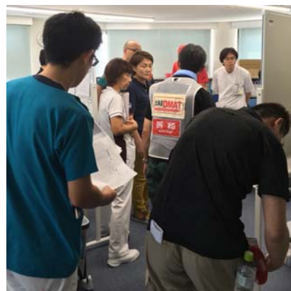
北海道DMATとのミーティング