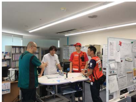
支援に来られた滋賀DMAT