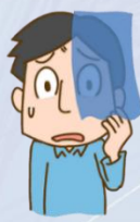
片目が見えづらい