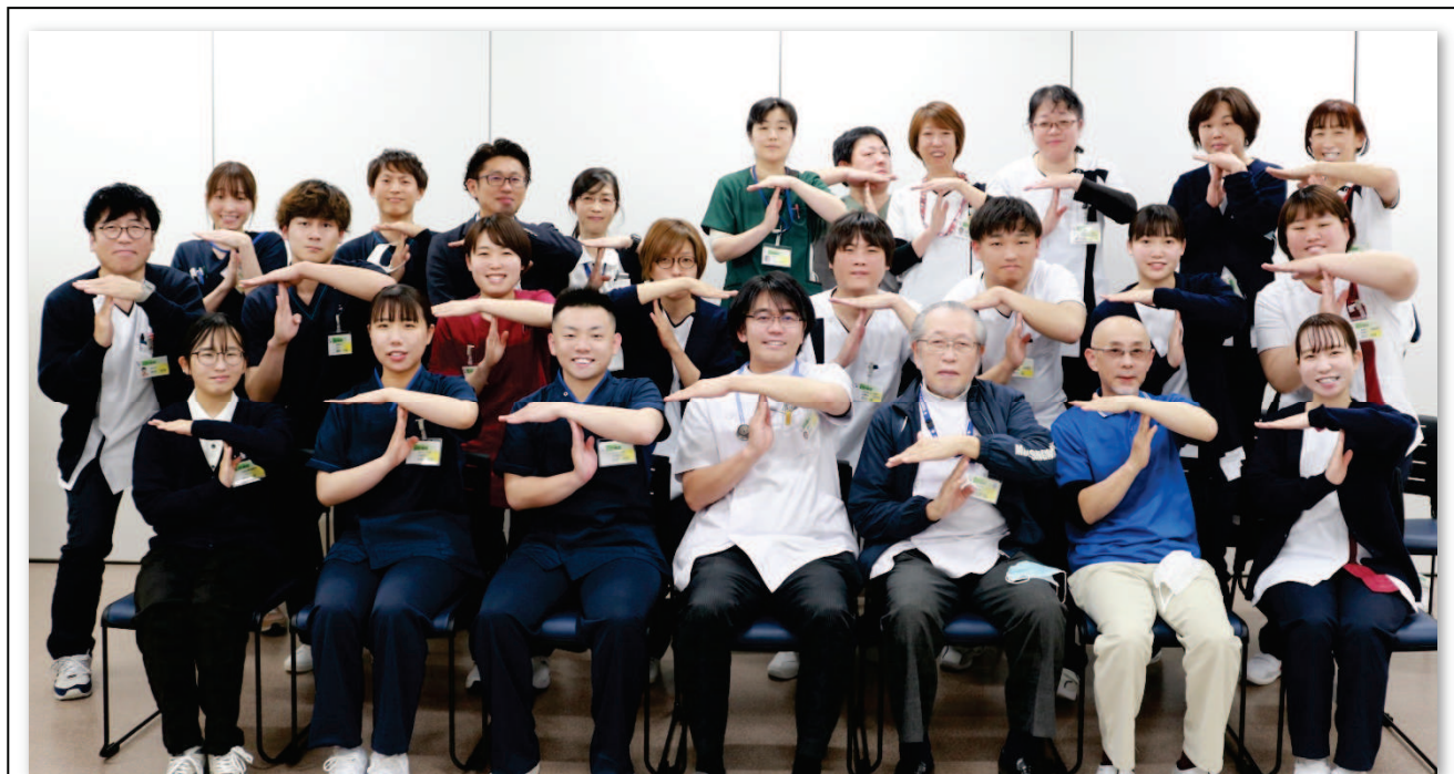
「令和5年度 新人職員オリエンテーションにて（田野病院のTポーズ）」

TANO HOSPITAL ホームページ http://www.usui-kai.com/ E-Mail: info@usui-kai.com