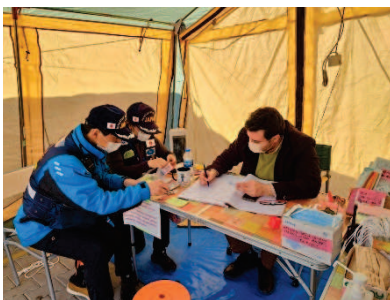
持参薬の鑑別の様子

最後になりますが、今回の派遣を支えてくださった病院や薬剤部スタッフをはじめ、関連機関の皆様へお礼を申し上げます。