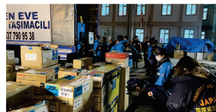
トラックからの荷下ろし