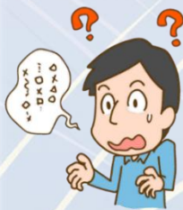
ろれつが まわらない