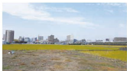
安城市の田園と市街地

さっぱりしているとよく言われる街ですが、特産であるイチジクや手延べ素麺 (1本で3mの長さです)、毎年催される安城七夕祭りは市民の自慢です。興味があれば是非調べてみて下さい。