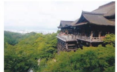
京都の清水寺

ところで趣味と言うほどではないですが、私は旅行が好きです。中でも京都は特別で度々訪れた事があります。一昨年の今頃も、仕事終わりに夜行バスに乗り、京都へ行きました。以前タクシーの運転手さんに勧められた早朝の清水寺を一度訪れてみたかったからです。実際に向かうと、地元の方たちが朝の散歩や参拝に訪れているだけで、普段の賑わいとはかけ離れたとても静かで厳かな雰囲気でした。清水の舞台もほぼ貸し切り状態で、京都の町並みが朝焼けで染まっていく様子はとても美しかったです。