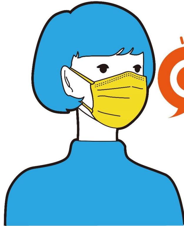
鼻とアゴにしっかりフィット