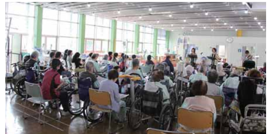
田野病院リハビリテーション室にて