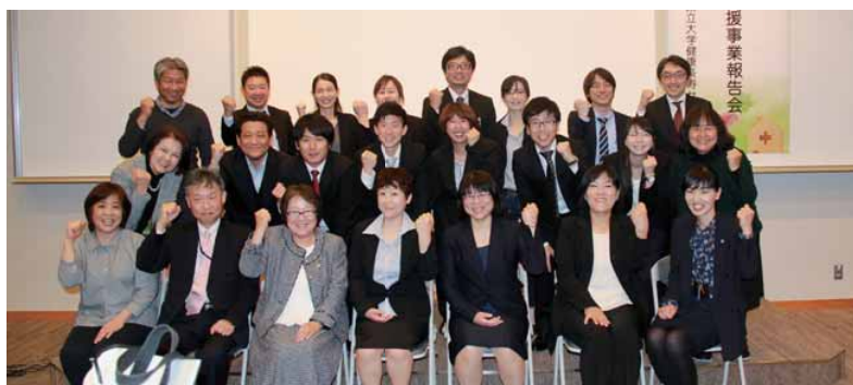
H30.3.15 平成 29 年度退院支援事業報告会にて

退院支援事業は終了となりましたが、私たちにとってはここからがスタートです！課題は沢山ありますが、本支援を受けて形成した「患者様の在宅復帰に向けた退院支援」の仕組みをさらに成熟させ、地域全体の医療・介護の質向上を実現できるよう、また患者様・ご家族に心から喜んでいただけるよう、法人一同取り組みを継続して参ります！