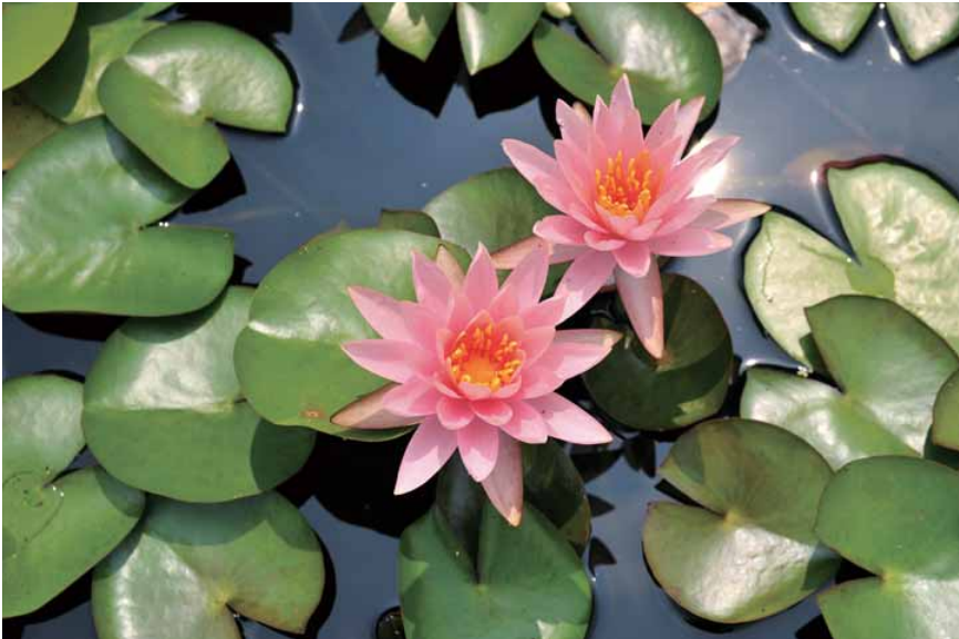
睡蓮 (岡山県 餘慶寺)

TANO HOSPITAL ホームページ http://www.usui-kai.com/ E-Mail: info@usui-kai.com