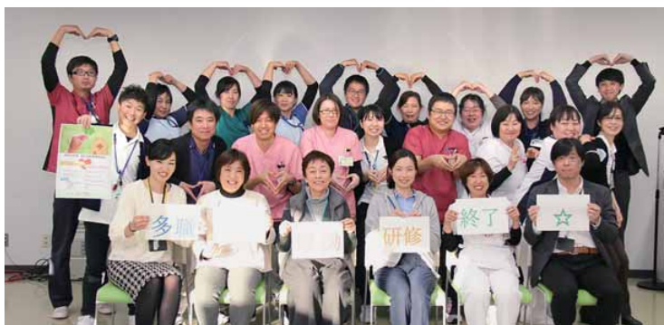
H30.2.7 第6回多職種協働研修にて

また当法人にとって、本事業の成果と収穫は？と聞かれはっきり挙がることは、院内外のメンバーと一緒にグループワークを重ね、皆で考え、悩み、意見交換することで、少しずつですがお互いの職種・役割を理解しあえたことです。地域・病院共に患者・家族を主体として退院支援に対する想いは同じですが、それぞれの立場から見ると、退院支援の形が違って見えていたことに気づくことができました。