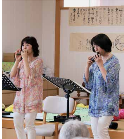
デイサービスたのにて