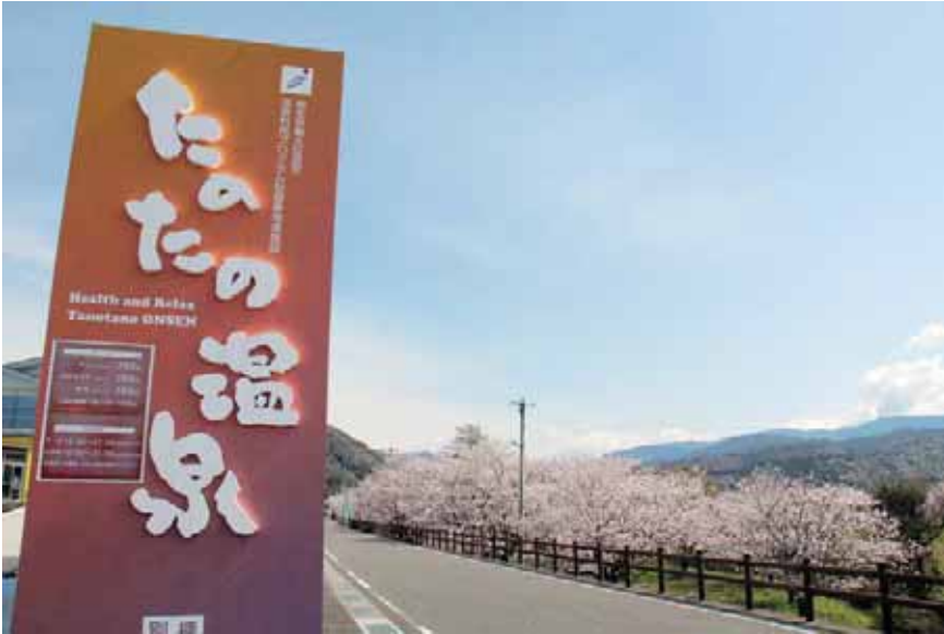
桜と山並みと温泉と (二十三士公園)

TANO HOSPITAL ホームページ http://www.usui-kai.com/ E-Mail: info@usui-kai.com