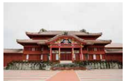
首里城・正殿（沖縄県那覇市）