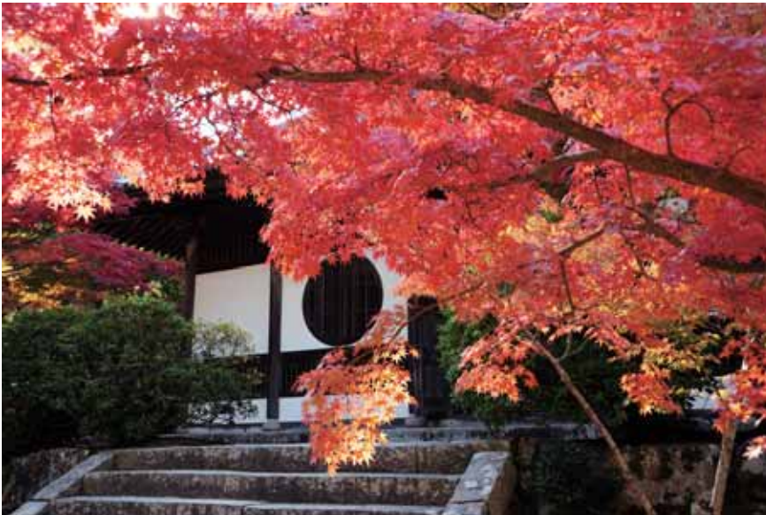
宝福寺（岡山県総社市）

TANO HOSPITAL ホームページ http://www.usui-kai.com/ E-Mail: info@usui-kai.com