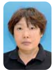
しまた だ おゆみ 歯 朶 尾 由 実

①回復期リハビリ病棟／介護福祉士 ②高知市 ③ドライブ・自宅でのんびりする ④わからないことはどんどん質問し、早く業務を覚えていきます。