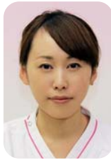
しま だ 田 あい 藍