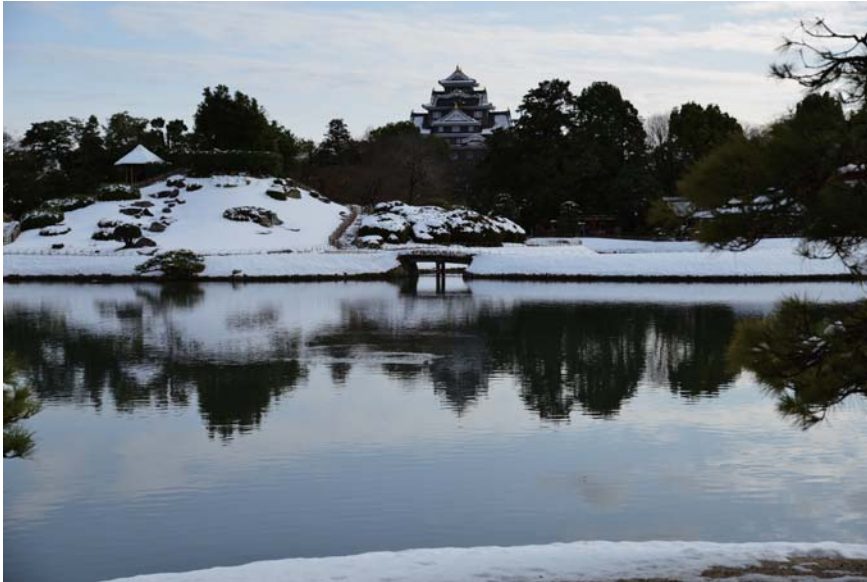
後楽園 雪景色(岡山県岡山市)

TANO HOSPITAL ホームページ http://www.usui-kai.com/ E-Mail: info@usui-kai.com