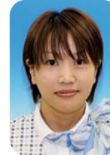
よ し む ら か 香 吉 村 奈