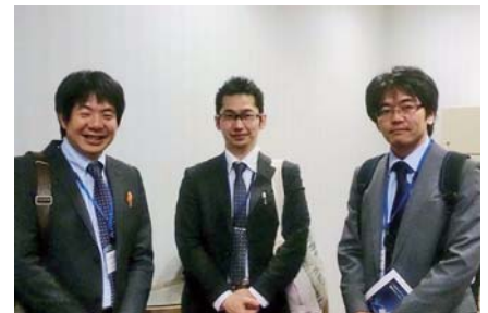
てんかんセンター同期の先生方と (筆者写真右)

2015年10月30日～31日と長崎で行われた第49回日本てんかん学会学術集会に参加してきました。私はてんかんを専門にしていますので、この学会には欠かさず参加するようにしています。今回は「乳児焦点性移動性部分発作を呈した2症例におけるケトン食療法の有効性」という演題を共同演者として発表してきました。また、てんかん学会では静岡てんかん神経医療センターで共に学んだ仲間たちやお世話になった先生方にお会いするのも楽しみの一つです。皆、各地で大変活躍されていて、私も頑張らねばといつも良い刺激を受けます。これからも、高知県のてんかん診療の充実に力を尽くしていきたいと思っております。